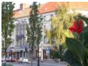
Filmpalast Neue Zeit, Töpferstraße

Barfüßerstraße 6 Tel. 0 36 31/98 42 15 Öffnungszeiten: Die. bis So.: 10 - 17 Uhr