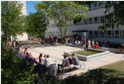
Campus der Fachhochschule

technik. Die Angebote reichen weiter bis zum Sozialmanagement, Gesundheits- und Sozialwesen. Zu weiteren Bildungseinrichtungen gehören eine Medizinische Fachschule und ein Studienkolleg für die Vorbereitung ausländischer