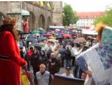
Tradition: Rolandsfest im Juni

stehende Roland. Ihm zu Ehren feiern die Nordhäuser im Juni das traditionelle Rolandsfest. Kulturelles und geselliges Leben in der Stadt werden durch ein Mehr - Sparten -Theater, zwei Museen und ein Kunsthaus, eine Stadtbibliothek und durch ein modernes