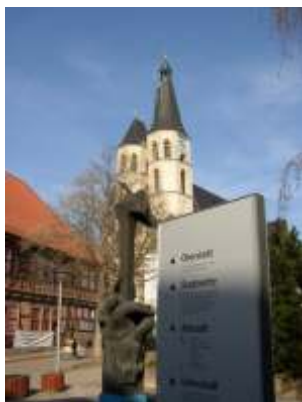
St. Blasii Kirche

Sanierungen im Rahmen der Landesgartenschau im Jahr 2004 haben das Stadtbild aufgewertet. Neue Wege, Plätze und Treppen laden jetzt zum Bummeln und Verweilen in die Stadt ein und treten in einen spannungsreichen Kontrast zur historischen Altstadt.