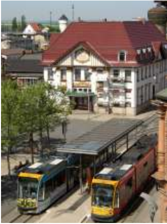
Harzquerbahnhof Nordhausen Nord

Personalausweis/ Reisepass Bürgerservice Markt 15 Tel. 0 36 31/ 69 65 55 buergerservice@ nordhausen.de