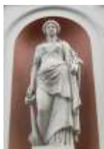
Athene am Gebäude der Stadtbibliothek

Stadtbibliothek „Rudolf Hagelstange“ W. - Nebelung - Straße 10 Tel. 0 36 31/98 37 95, Fax: 0 36 31/97 40 64 bibliothek@nordhausen.de Öffnungszeiten: Mo., Die., Do., Fr.: 12 - 18 Uhr Mi.: 9 - 12 Uhr