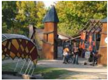
„Ritterburg“ auf dem Petersberg

Seniorenbegegnungs- zentrum Nord Stolberger Straße 131 Tel.: 03631/ 88 10 53