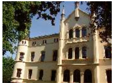
Landratsamt, Grimmelallee 23