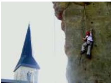
Kletterfelsen auf dem Petersberg

Harzer Schmalspur- bahnen GmbH Bahnhof Nordhausen Nord Tel. 0 36 31/62 61 0 oder 0 39 43/55 8-0 Info@hsb-wr.de www.hsb-wr.de