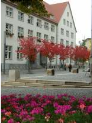
Neues Rathaus, Markt 15

Gewerbebean- Gewerbeabmeldungen Ordnungsamt, SG Gewerbe Markt 15 Tel. 0 36 31/69 65 63 gewerbeamt@nordhausen.de