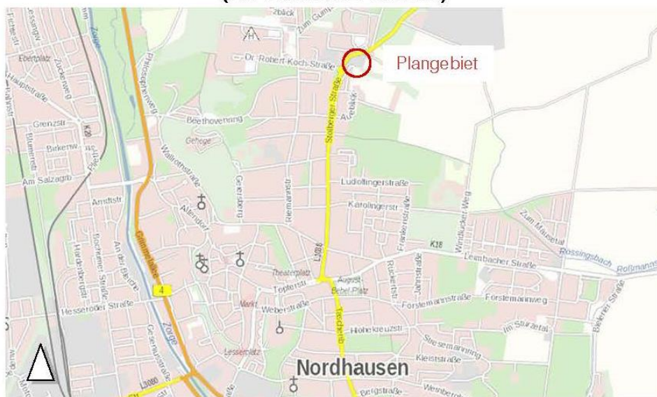
Quelle – Karte: Geoproxy-Geoportal © GDI-Th Freistaat Thüringen ( www.geoproxy-geoportal-th.de/geoclient ), Darstellung ohne Maßstab