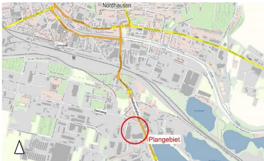
Darstellung ohne Maßstab