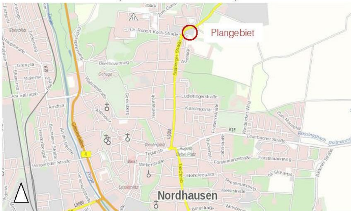
Darstellung ohne Maßstab