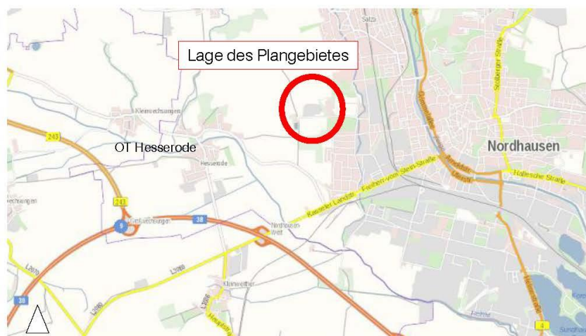
Quelle-Karte: Geoproxy-Geoportal GDI-Th Freistaat Thüringen ( www.geoproxy-geoportal-th.de/geoclient/ ); o.M.